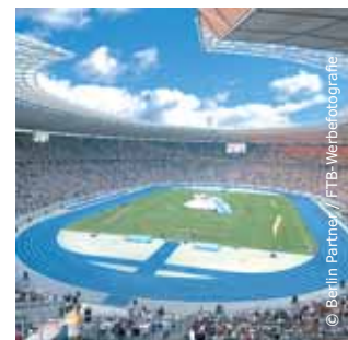
Olympiagelände/ Olympiastadion Berlin

Dienstleistungen: ■ Veranstaltungsmanagement ■ Facility Management ■ Vermarktung ■ Gastronomie ■ Sicherheits- und Ordnungsdienste